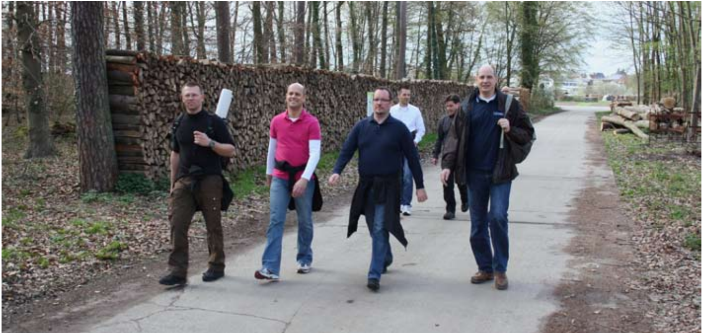
EGA Wochenende der WJ Mannheim-Ludwigshafen