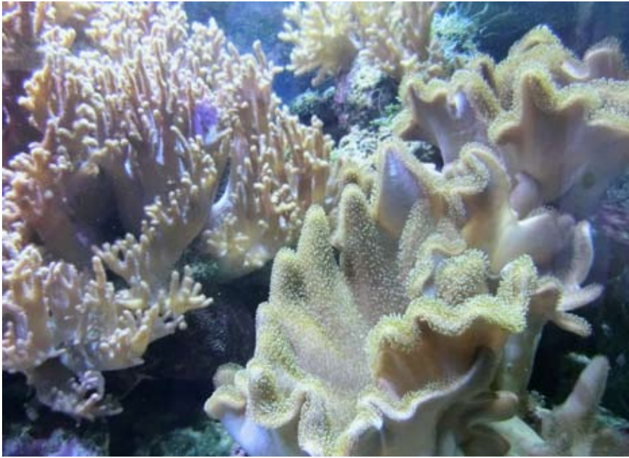
Besuch der Wirtschaftsjuvenoren bei JBL in Neuhofen