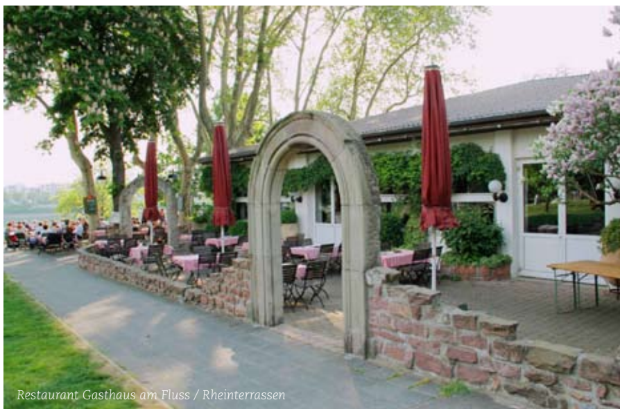
Restaurant Gasthaus am Fluss / Rheinterrassen

Wir werden durch die Locations das Motto der LaKo, „60 Jahre Lust am Leben“, unterstreichen und die Entwicklung der Metropolregion Rhein Neckar von der Industriegesellschaft Mitte des 20. Jahrhunderts hin zu einer modernen, sich wirtschaftlich öffnenden Region mit hoher Lebensqualität aufzeigen. Unsere Gäste werden die Wirtschaftskraft und Lebensfreude unserer Heimatregion erleben und als Multiplikatoren dieses Lebens- und Wohlfühlens mit nach Hause nehmen. Auch im Hinblick auf die Sponsoren werden repräsentative Locations gewählt, in denen spannende Events stattfinden werden.