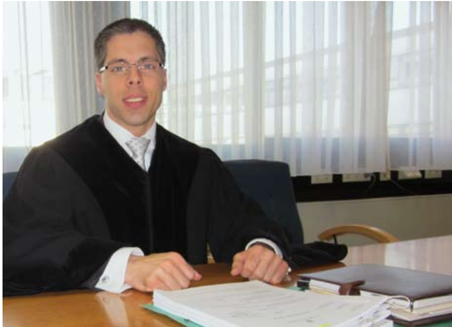
Ehrenämter bei der IHK